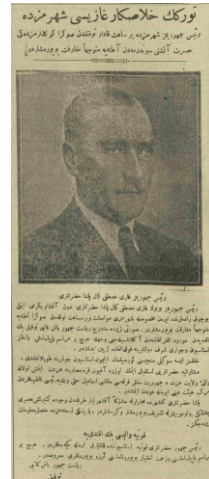
9 Mayıs 1926 tarihli Babalık Gazetesi, 1. sayfa: Atatürk'ün Akşehir ziyareti haberi.

Altan; 2 Nisan 1924'te Akşehir başöğretmenliğine, 12 Eylül 1925'te Akşehir I. Erkek Mektebi öğretmenliğine, 11 Ocak 1926'da da Akşehir İmam Hatip Mektebi Türkçe öğretmenliğine başlamıştır. 1 Eylül 1926'da Akşehir Hadika-i Marifet Kız İlk Mektebi başöğretmenliği yapmış ve 7 Kasım 1926'da Akşehir 'deki üç yıllık öğretmenlik hayatı son bulmuştur.