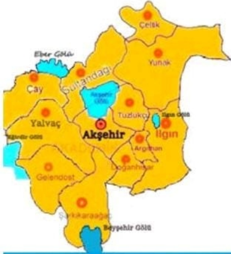
Akşehir İli Haritası

MHP Genel Başkanı Devlet Bahçeli'nin Cumhuriyetin 100. yılı olması nedeniyle söylediği "100 il, bin ilçe" teklifi sonrasında Akşehir'in il olması isteği yeniden gündeme geldi.